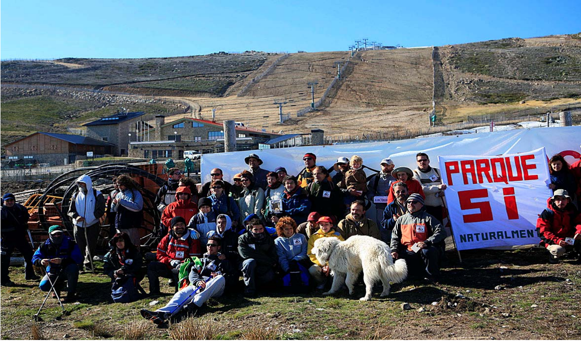
Estación de esquí o conservación... esa es la cuestión

montañas, el asunto queda así: abrazo la mano que me da de comer, aunque me de un palo y ello implique la pérdida la dignidad, dejando de ser consecuente con mis principios.