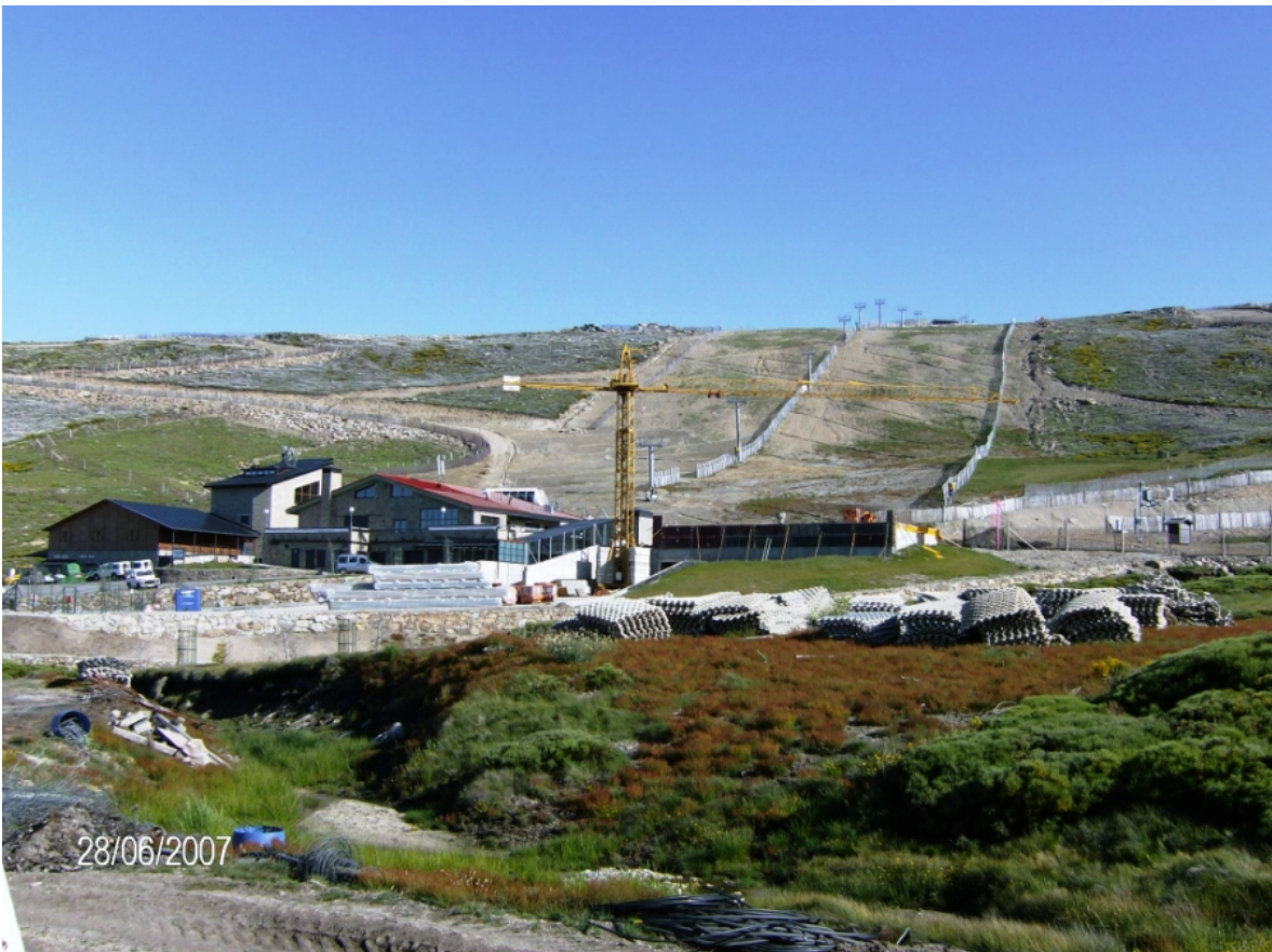
Las obras son constantes y terriblemente dañinas al entorno

Todo esto es así hasta que en 2006 Gecobesa presenta lo que pomposamente llama Plan Director, que no es si no la legalización de todas las infracciones ya cometidas, y la irrupción en más terrenos LIC y ZEPA, incluyendo la cabecera del circo glaciar de la Garganta del Oso, lo que supone en sí el desplazamiento de la estación hacia la zona plana del Calvitero y hacia las pretensiones de muchos personajillos (hosteleros, políticos, constructores, promotores urbanísticos -entre los que se encuentra de manera principal el propio director de La Covatilla - ¡Qué casualidad ¿no?!) de unirla con el área del Calvitero, encima del pueblo de Candelario. La siguiente ficha la mueve la Junta de Castilla y León. ¿Cómo?, ¿dándole un tirón de orejas a Gecobesa por hacer las cosas tan prepotente y descaradamente?. No. La Junta, con la evidencia que cometió en el caso San Glorio, se cura en salud y contesta a estas infracciones en materia de medio ambiente, ¡¡suspendiendo la tramitación del Parque Natural de Candelario!! . Aunque no acaban ahí sus maniobras pro-estación: llegados a este punto, los técnicos encargados del Estudio de Impacto Ambiental elevan una Declaración positiva al Plan Director, en vez de recriminar y solicitar la sanción de las ilegalidades cometidas (¡¡¡una de las pistas ilegales llega a penetrar en el mismísimo Parque Regional de la Sierra de Gredos!!!).