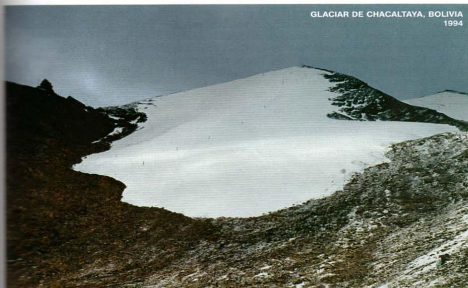
GLACIAR DE CHACALTAYA, BOLIVIA 1994

Hace años, dice un esquiador, «las condiciones eran fantásticas» en la estación de esquí más alta del mundo (5.260 metros), en el glaciar de Chacaltaya, Bolivia. Hoy pocos intentan el descenso. El glaciar ha retrocedido en la pasada década, convirtiendo gran parte de la ladera en un pedregal.