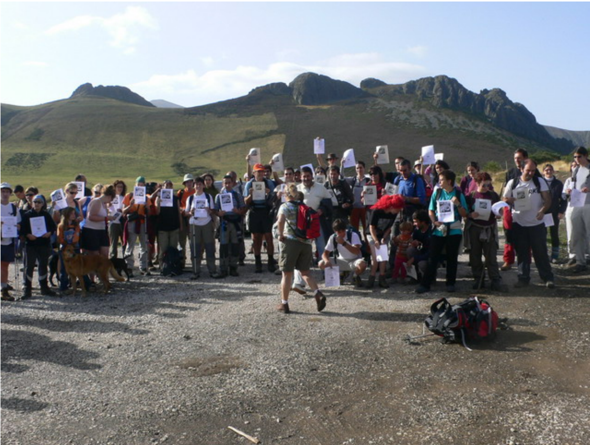
Parte de los congregados exhibían un ¡no! contundente

Esta temporada invernal pasada, habrá sido esclarecedora de cual es el verdadero negocio que se traen entre manos los especuladores y sus amigos. Las estaciones de la Cordillera Cantábrica y parte del Pirineo han acumulado pérdidas en sus balances del año 2006-2007. Se nota el cambio climático y la taquilla se resiente. Está claro que ese negocio no tiene futuro, pero donde les dejan, siguen urbanizando más y más valles, convirtiendo áreas de montaña en más lugares urbanos comunes, con lo que se empobrece el territorio y pierde atractivo y posibilidades. Esa carrera desarrollista está acabada hace ya muchos años. Ese no es el camino. Los encargados de velar por el patrimonio de todas y todos, son insensibles a la conciencia medioambiental existente, y se dejan llevar por el pan para hoy y hambre para mañana, propiciando hasta cambios legislativos irracionales e irreparables. El futuro sólo es con protección y conservación de todas nuestras áreas de montaña, con proyectos de desarrollo sostenible social y ambientalmente.