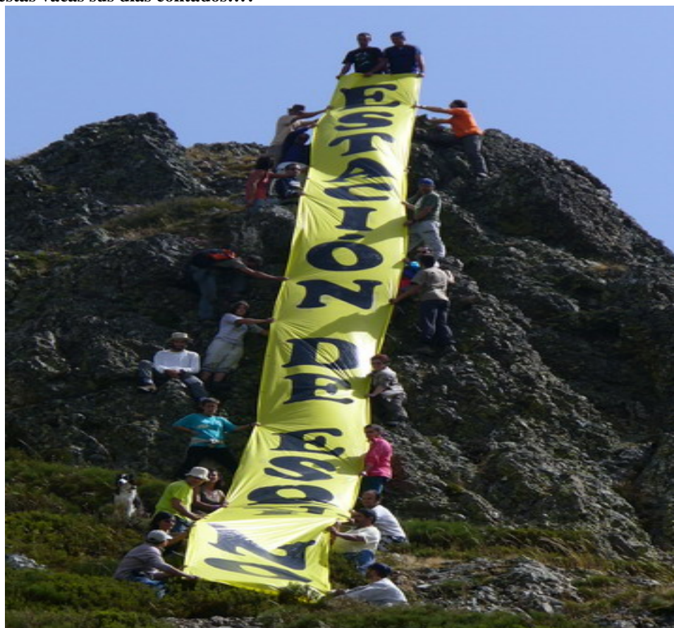
Múltiples colaboraciones hicieron posible la colocación provisional de la pancarta