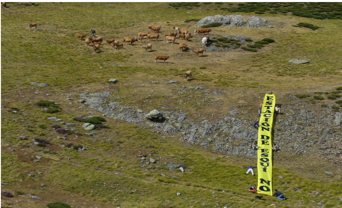
¿Tienen estas vacas sus días contados...?