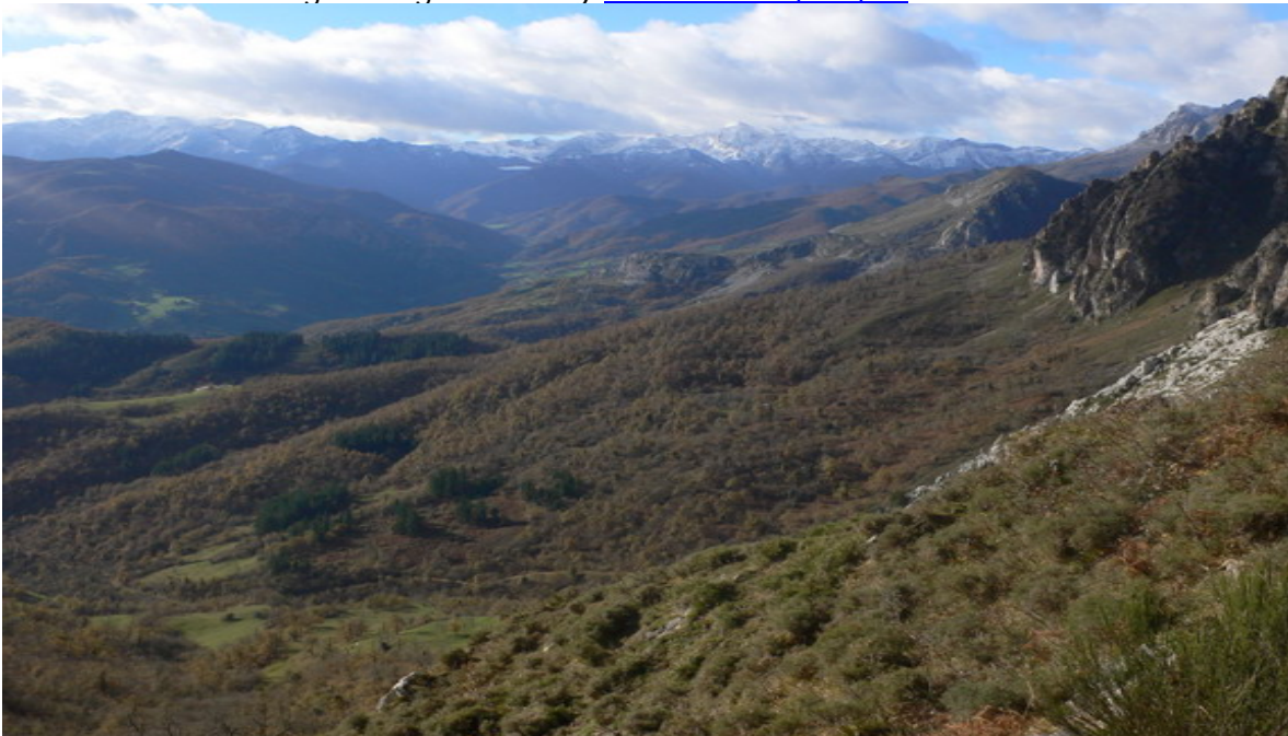
Corisco desde Picos de Europa

Más información sanglorio@gmail.com y webmaster@pdsq.es